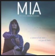
Mia – Maxime Flourac musique originale