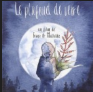
Le plafond de verre – Mathilde Fénérier / François Revouy musique originale