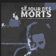
Le séjour des Morts – Stéphanie de Pablos musique originale