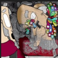
Déconnexion – Maud Mitelman musique originale, bande son