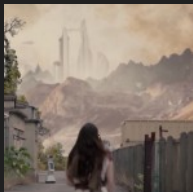
Algorithm – Quentin Dupuy musique originale